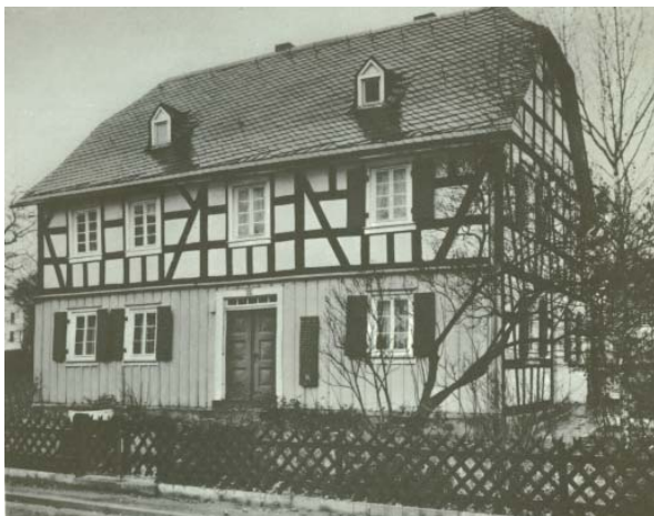
Das Flammersfelder Bürgermeisterei. Hier lebte und arbeitete Raiffeisen.

Auf Grund der Versetzung schlofen die Geschäfte des Hilfsvereins 1854/55 fast ein. An dessen Stelle wurde später ein Darlehnskassenverein gegründet 52 .