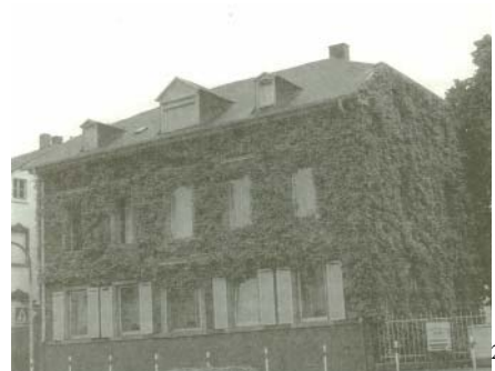
Das Bürgermeisterhaus zu Heddesdorf.